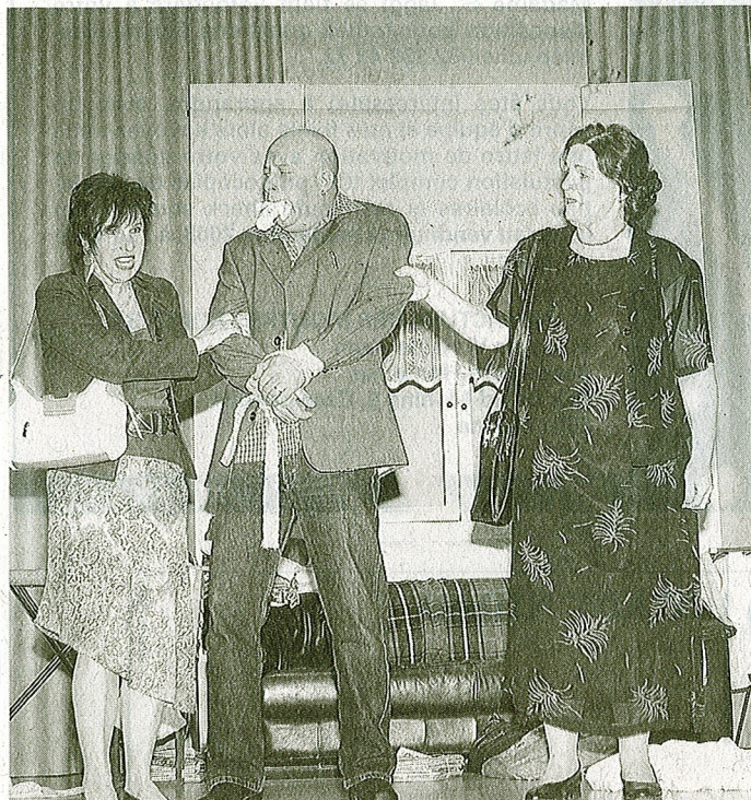
Voller Einsatz: Mitglieder des Theatervereins Worben.